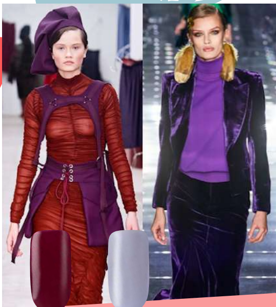
268 MAGENTA PURPLE 717 FABULUX