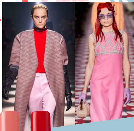
270 ROSE TAN 770 FABULUX

IDEAL PARA EL MANTENIMIENTO DE LA MANCURA EN CASA